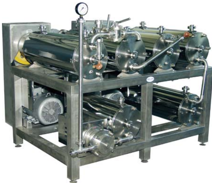
Рис. 2. Маслообразователь ТВФ-1 производительностью 2000 кг/ч

2. Вторая стадия (обращения фаз) происходит не так быстро и лавинообразно. При этом образуется промежу-